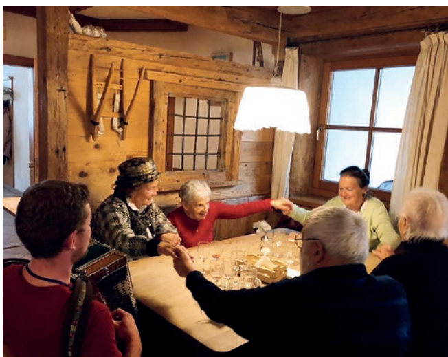
Beim alljährlichen Törggelen wird auch musiziert!

ginn intensiv sein muss und über den gesamten Krankheitsverlauf, angepasst an die verschiedenen Phasen, durchgeführt werden muss – selbst in den fortgeschrittenen. Eine angemessene Rehabilitation wäre eine Erleichterung und großer Vorteil für die Lebensqualität von Menschen mit Parkinson und deren Familien. Gleichzeitig wäre es aber auch ein finanzieller Nutzen für den öffentlichen Haushalt, da bei den Betroffenen das Fortschreiten der Krankheit verlangsamt und ihr Leben in Selbstständigkeit verlängert wird.