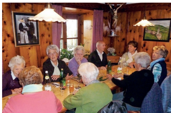
Törggelen Barbian 2016