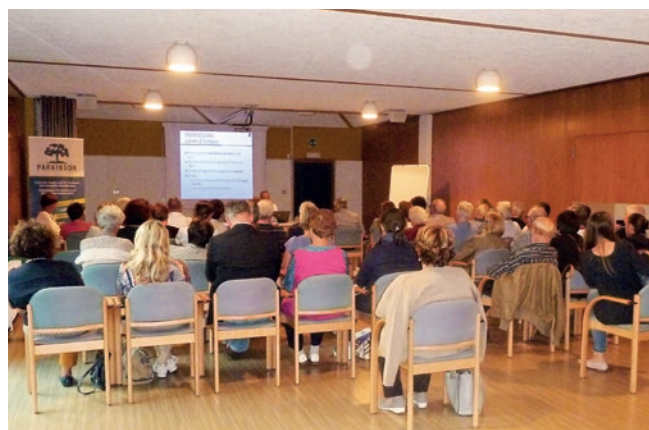
Vortragsreihe 2016 in Neumarkt