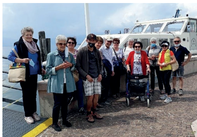
Eine beliebte Veranstaltung der Parkinsonvereinigung: Die Erholungswoche in Salò am Gardasee.

Wie viele von Ihnen wissen, hofften wir, dass der Südtiroler Gesundheitsbetrieb SABES die Rehabilitation einführen würde. Seit drei Jahren nehmen wir an der ASL-Arbeitsgruppe für den sogenannte PDTA (Percorso diagnostico terapeutico assistenziale) teil, der in anderen Regionen und Provinzen (zum Beispiel in Trentino und Venetien) Anwendung findet. Leider haben wir nichts mehr davon gehört. Und es fehlt an gezielter Behandlung aufgrund multidisziplinärer Diagnose: an genauen Untersuchungen und der notwendigen Aufklärung, um mit dieser schwierigen Krankheit zu leben. Es fehlt zudem an individueller Rehabilitation, welche zu Be-